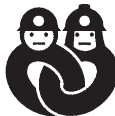
「消防団協力事業所表示制度」 表示マーク