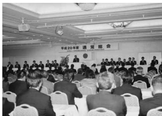
児玉会長代行あいさつ

なお、平成20年度における全国建設業協会会長、宮崎県建設業協会会長等の表彰受賞者は別記のとおりです。おめでとうございます。