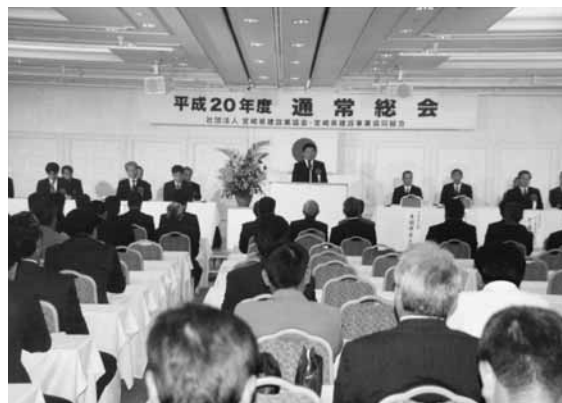
宮崎県議会議長祝辞